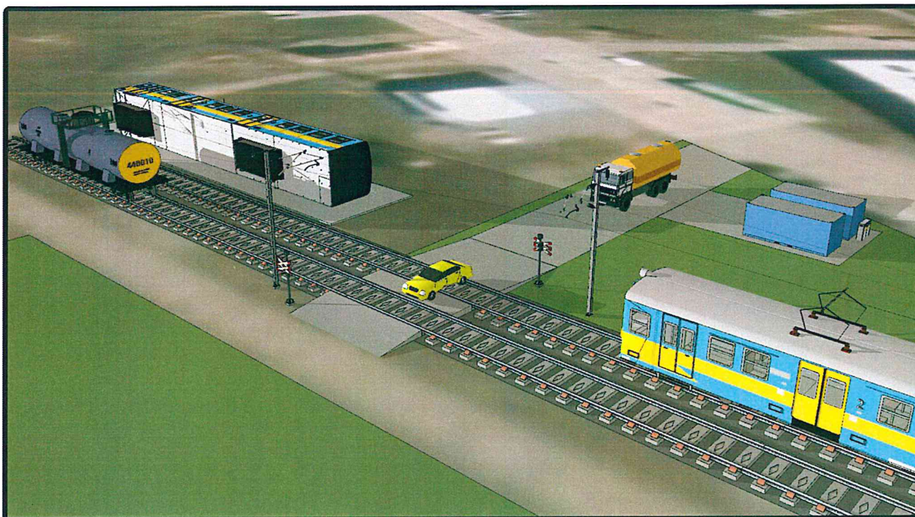
Rys. 2. Przykład wykorzystania przedmiotowego kolejowego stanowiska ćwiczebnego.